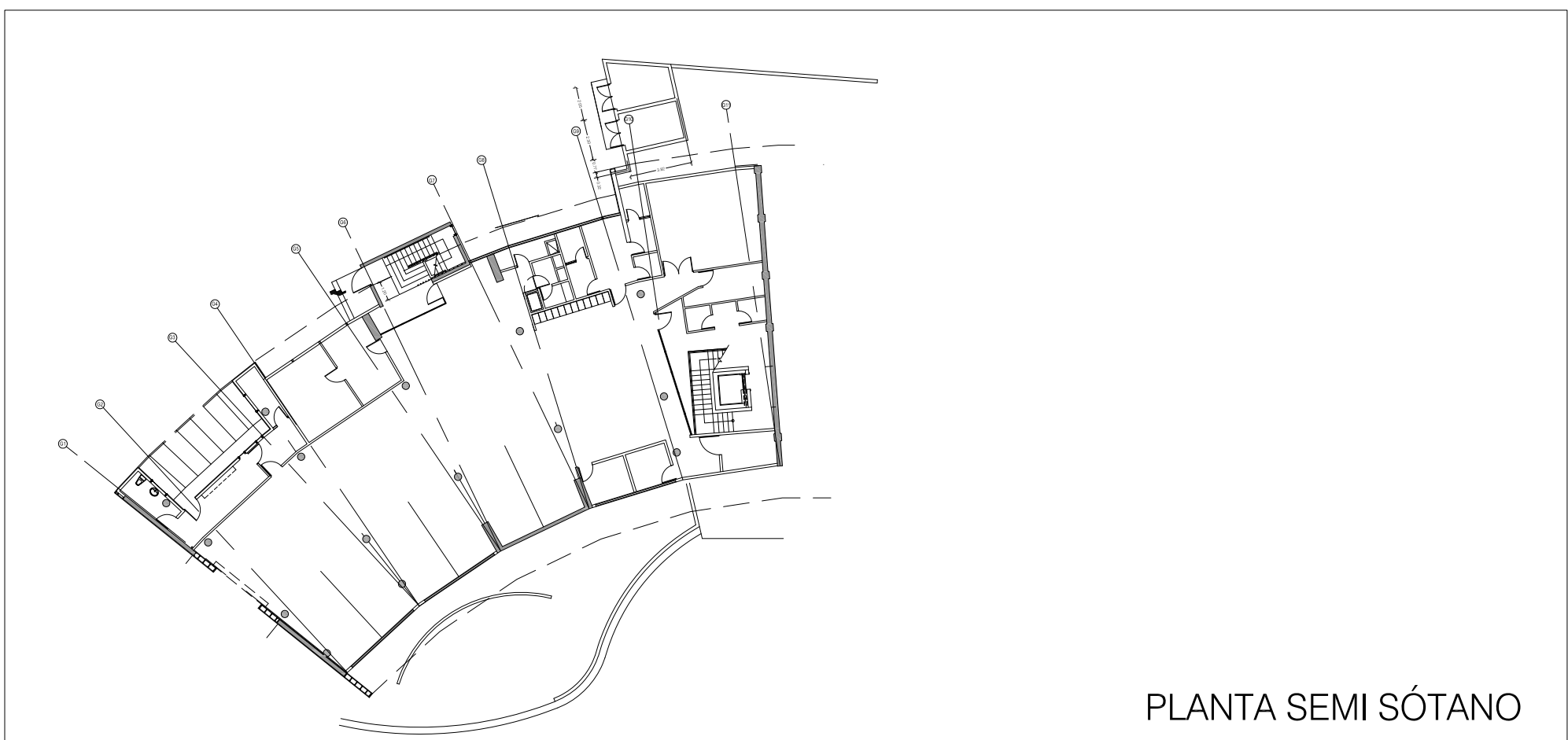
PLANTA SEMI SÓTANO